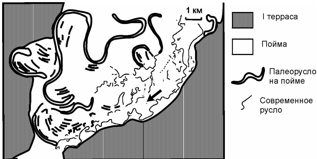
Рис.3. Соотношение древнего и современного русел на пойме реки Орель, левый приток Днепра.

соответствующий ландшафт. Ее площадь только увеличилась за счет ширины отмерших заиленных и заболоченных макрорусел. Современные реки извиваются узкими лентами среди этих унаследованных пойм, лишь в малой степени изменяя первоначальный рельеф в своей прирусловой зоне. Примером такого соотношения древнего и современного русла является река Орель, бассейн Днепра (рис. 3). На унаследованных поймах накапливается очень тонкий, насыщенный